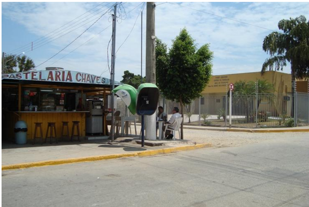
Figura 6 - Feira BrasBol e Vara do Trabalho de Corumbá