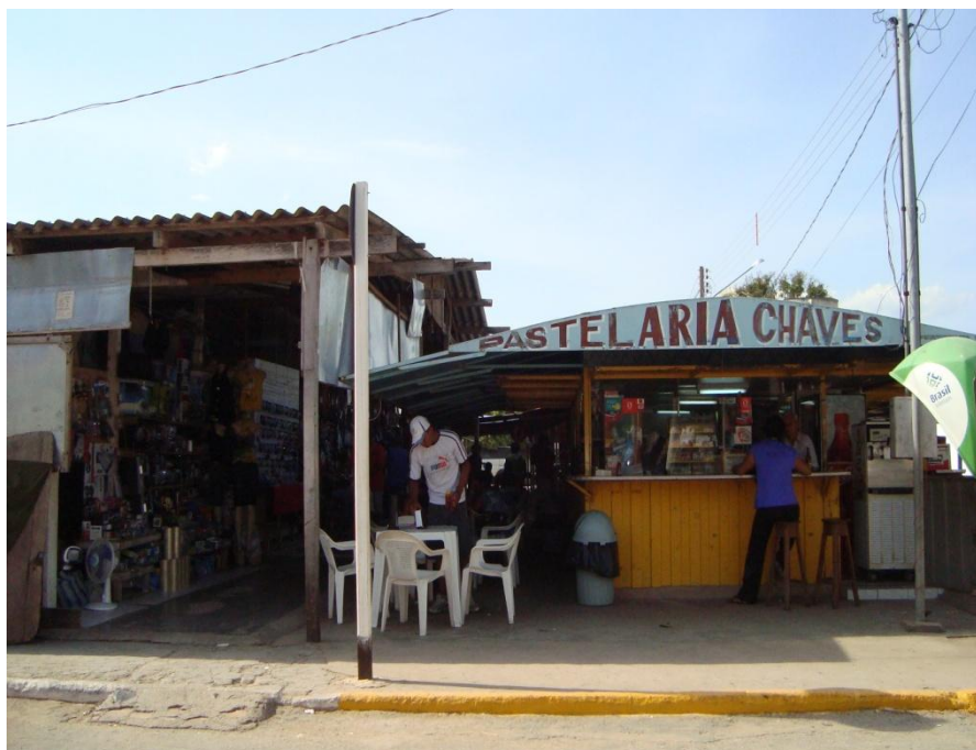
Figura 5 - Pastelaria Chaves