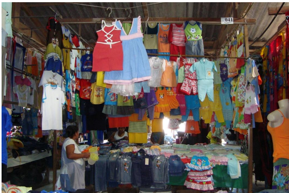
Figura 3 - Barraca de roupas