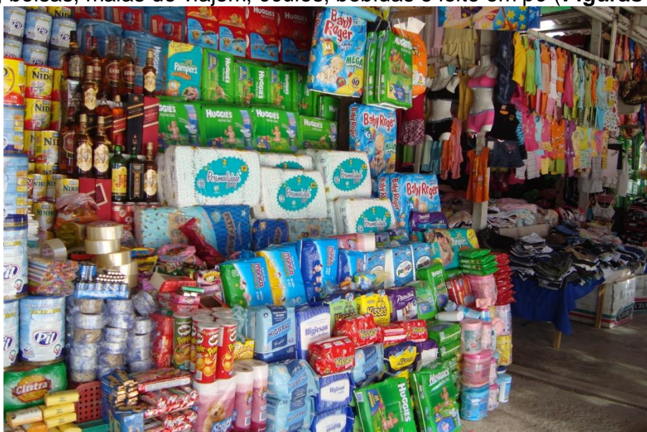
Figura 2 – Barraca de fraldas plásticas e outros

Como mencionado acima, na feira são comercializados vários produtos entre os quais roupas, celulares, eletrodomésticos, material de limpeza, fraldas plásticas, bijuterias, bolsas, malas de viagem, óculos, bebidas e leite em pó ( Figuras 2, 3 e 4 ).